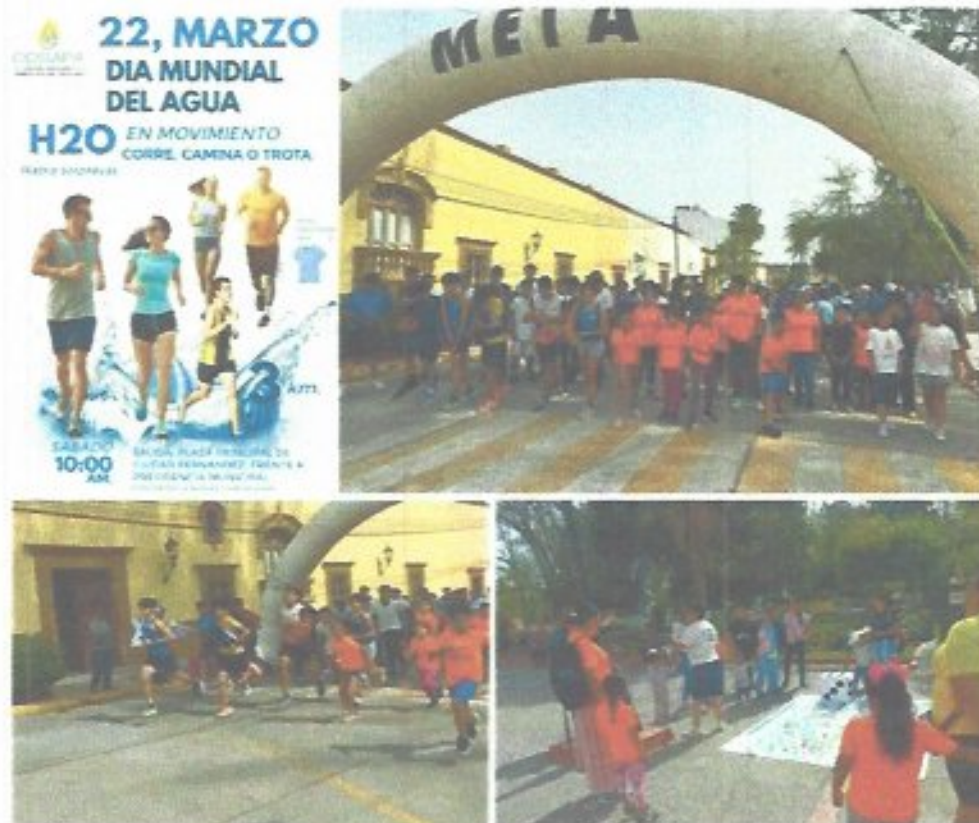
Figura 35. Carrera atlética organizada en conmemoración del día mundial del agua.