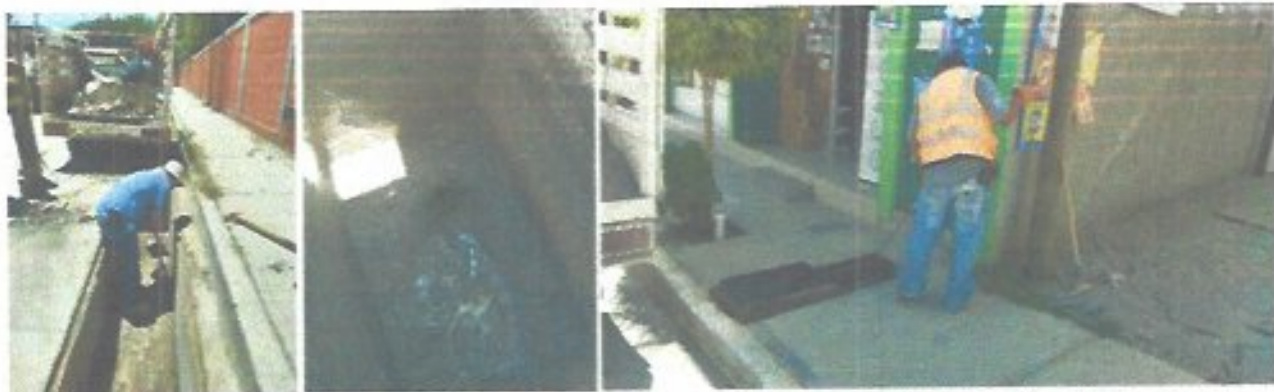
Figura 15. Desazolves en el sistema de alcantarillado sanitario.

Durante el periodo que se informa, se realizaron 162 desazolves en el sistema de alcantarillado sanitario, de los cuales 65 correspondieron a líneas centrales, 73 a descargas domiciliarias y 24 a pozos de visita. Adicionalmente, se efectuaron trabajos de limpieza y desazolve en bocas de tormenta y válvulas de desfogue de arenas, como parte de las acciones preventivas en la red pluvial y sanitaria. Estas labores permitieron restablecer el flujo adecuado de las aguas residuales, prevenir obstrucciones mayores y reducir riesgos de brotes e inundaciones, especialmente durante la temporada de lluvias.