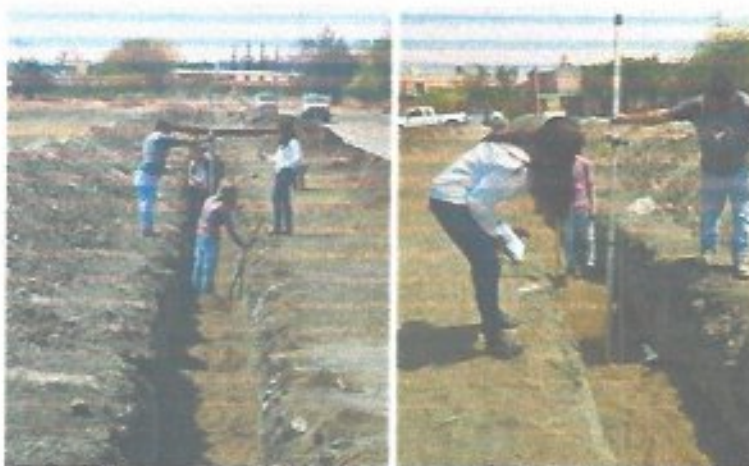
Figura 28. Supervisión de obras de agua potable y drenaje contratadas por el municipio.

Durante todo el año se brindó atención permanente a los contratistas del municipio, supervisando y verificando la realización de pruebas de hermeticidad en infraestructura de agua potable y en líneas de drenaje sanitario, con el propósito de garantizar la correcta ejecución de las obras, asegurar la calidad de los trabajos y prevenir fugas o filtraciones que pudieran afectar el adecuado funcionamiento de los sistemas.