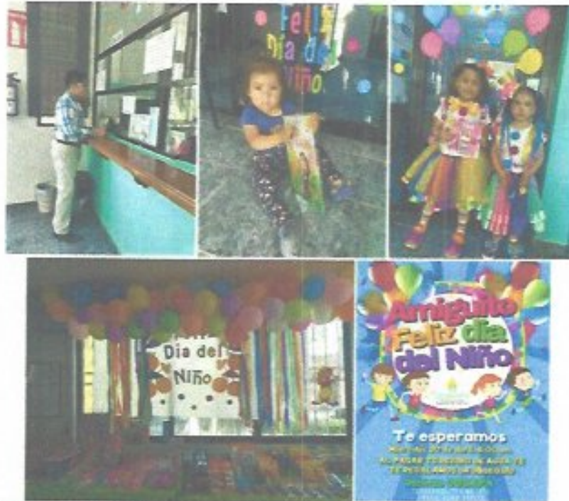
Figura 38. Campaña "Pago oportuno día del niño" entrega de regalos a los niños que acudieron a pagar su recibo del agua.