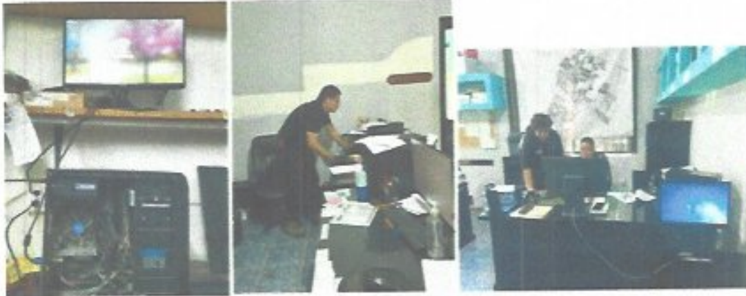
Figura 3. Mantenimientos preventivos y correctivos a equipos de cómputo.

También se les brindó mantenimiento a 3 conmutadores, 8 cámaras de seguridad, 2 veces se dio mantenimiento de software y 3 veces se revisó la red eléctrica.