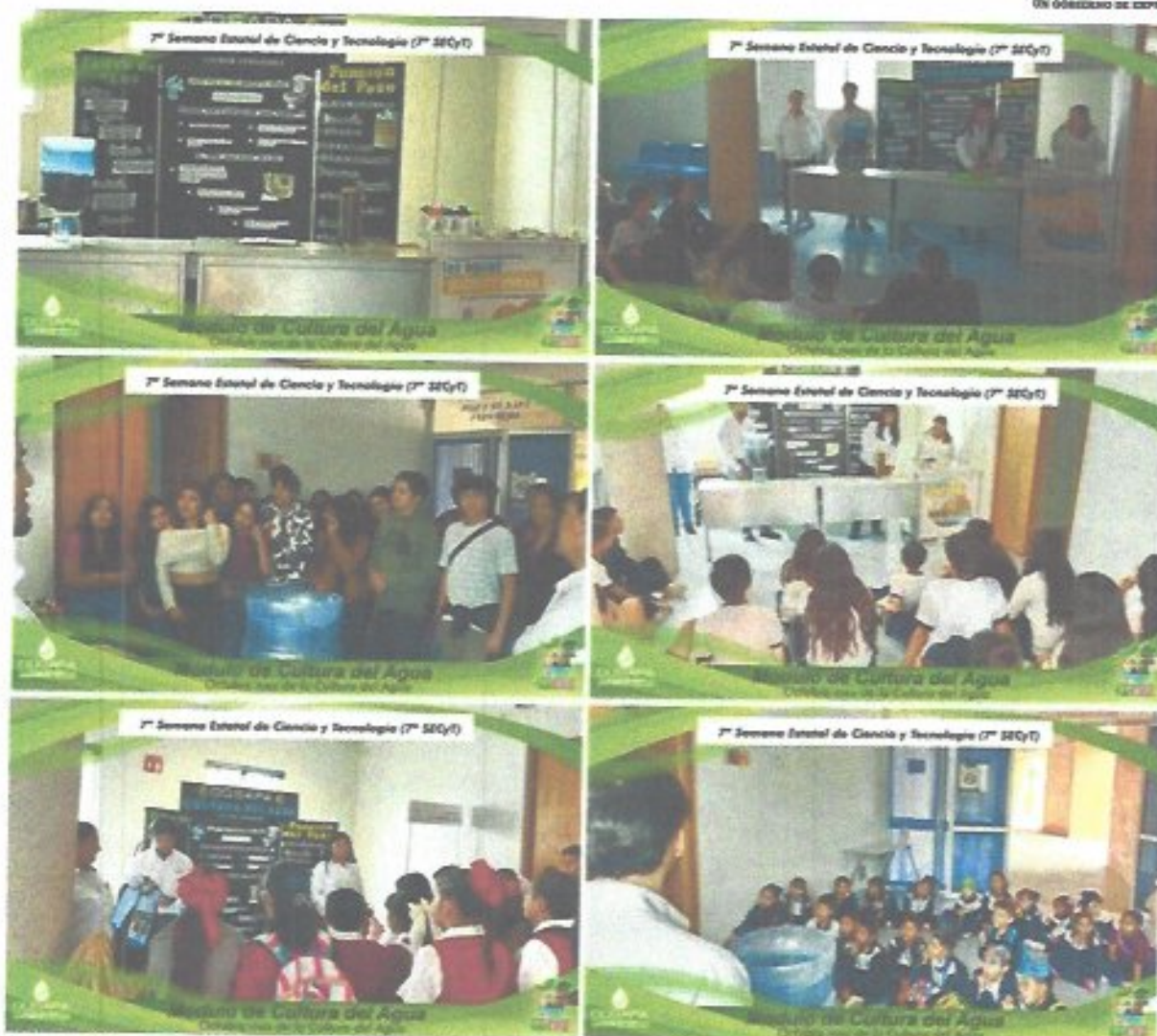
Figura 37. Instalación de Stand en el Balandrán apoyando con los temas "Funcionamiento de un pozo y Filtro de agua."