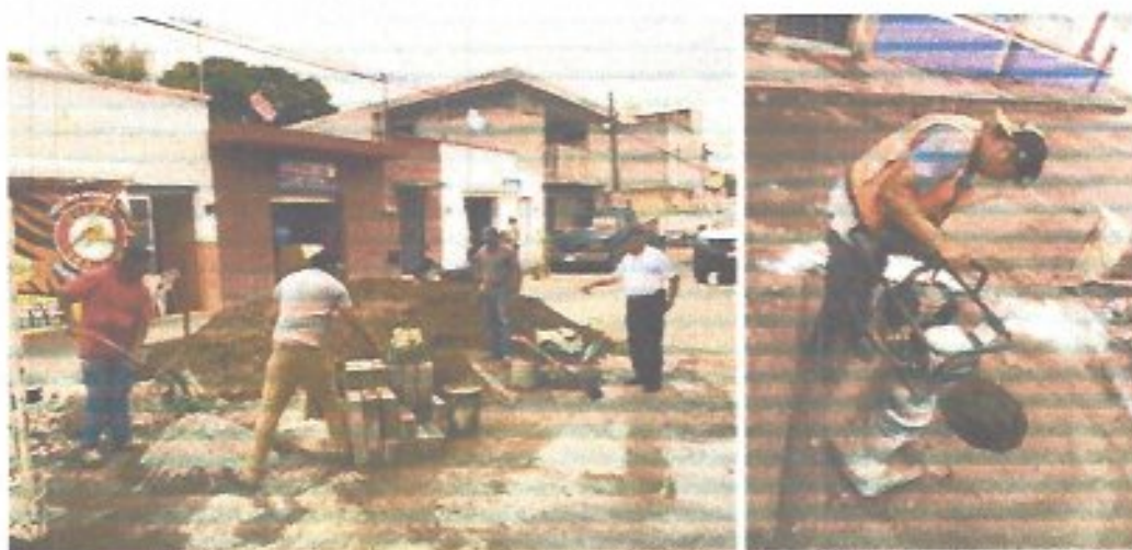
Figura 21. Construcción de Pozo de visita en calle Morelos, para resolver problemáticas de encharcamientos en el sector.