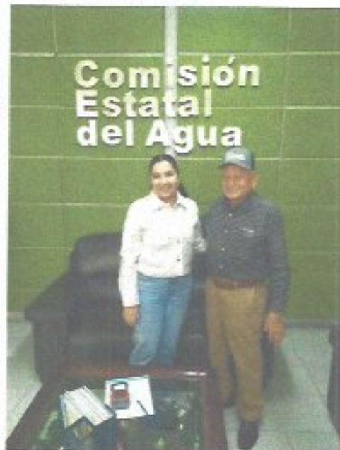
Figura 7. Visitas de trabajo y gestiones en dependencias estatales.

Durante el ejercicio 2025 se fortaleció la vinculación con entidades federales y estatales mediante la coordinación y colaboración en distintos ámbitos, tales como el intercambio de información, la organización y participación en cursos y capacitaciones tanto presenciales como en línea, así como la suma de esfuerzos orientados al cuidado y uso responsable del agua. Asimismo, se mantuvo colaboración directa con la Comisión Estatal del Agua de San Luis Potosí a través del programa Agua Limpia, logrando subsidiar parcialmente la adquisición de hipoclorito de sodio para la desinfección de las fuentes de abastecimiento. En el ámbito federal, se participó en el Programa de Devolución de Derechos (PRODDER), mediante el cual se recuperó un porcentaje de las cuotas pagadas durante el año por derecho de extracción fortaleciendo la gestión de recursos y el cumplimiento de las disposiciones en materia hídrica.