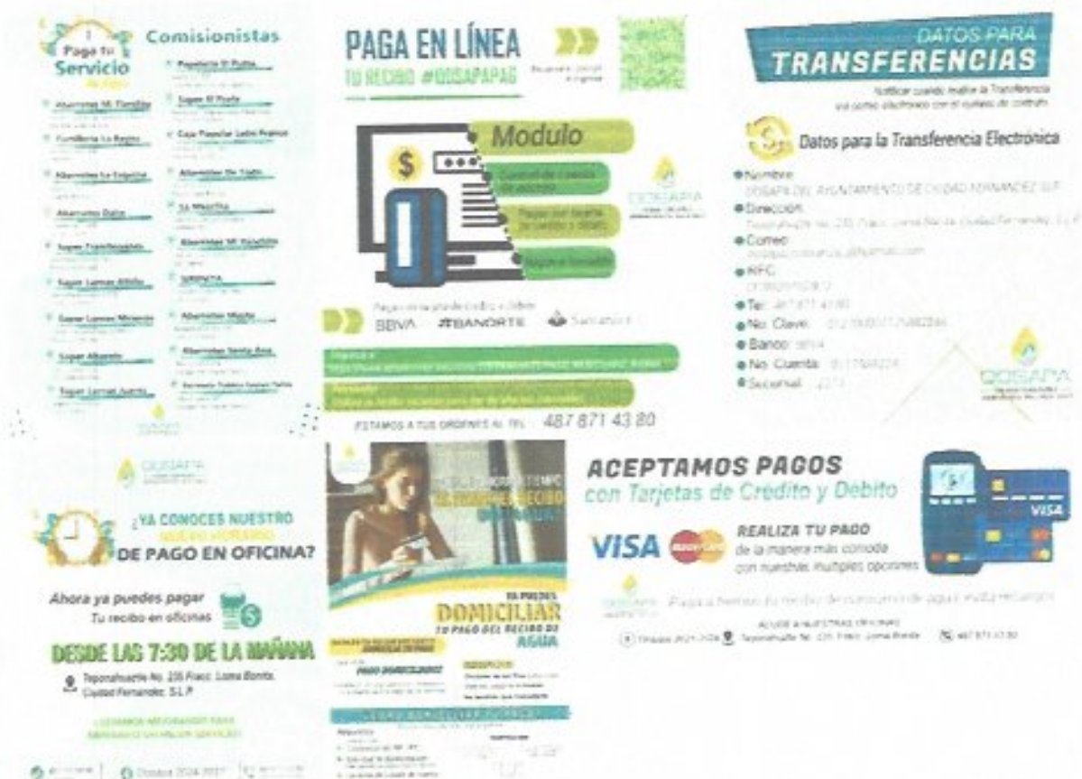
Figura 42. Difusión de información del área comercial.

El personal del área operativa realizó diversas acciones, entre las que destacan: obras de rehabilitación de redes de agua potable y drenaje sanitario, reparación de fugas, instalación de descargas domiciliarias de drenaje, instalación de tomas de agua potable, desazolves de drenaje, sustitución de medidores y reparación de baches derivados de intervenciones en la vía pública.