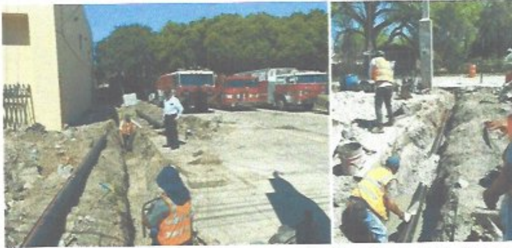
Figura 19. Construcción de descarga al honorable cuerpo de bomberos de Ciudad Fernández.