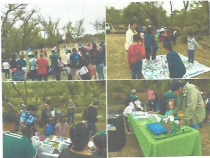
Figura 34. Actividades alusivas al día mundial del agua con alumnos de primaria y padres de familia llevadas a cabo en la ribera del río Verde.

una vida saludable, ya que es una forma divertida y dinámica de moverse, al agacharse y levantarse para recoger los residuos; con esto se concientiza a los niños en el tema del cuidado de nuestro planeta, en donde formamos equipos para realizar el recorrido y a su vez ir levantando la basura del lugar, también se llevó a cabo una breve charla sobre el uso sustentable del agua y la contaminación de nuestro planeta, posteriormente se realizaron juegos con los niños en el tema uso sustentable del agua y la contaminación, teniendo una respuesta satisfactoria a todas las actividades.