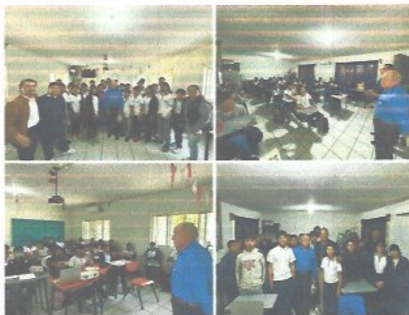
Figura 31. Platicas escolares a alumnos de primero, segundo y tercer año de la telesecundaria Lázaro Cárdenas.

En la escuela primaria general Zenón Fernández se llevaron a cabo las siguientes actividades: Charla sobre el uso sustentable del agua y contaminación impartida por el Dr. Juan Fernando Cárdenas González, también se realizaron dinámicas y juegos encaminados la concientización del uso sustentable del agua.