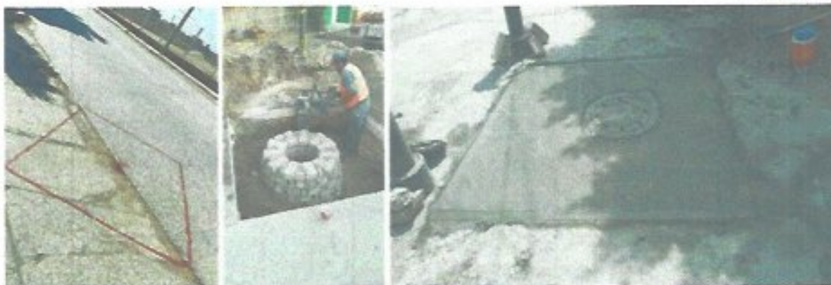
Figura 20. Construcción de pozo de visita en la intersección de calle Pipiala y Moctezuma para mitigar encharcamientos en la zona.