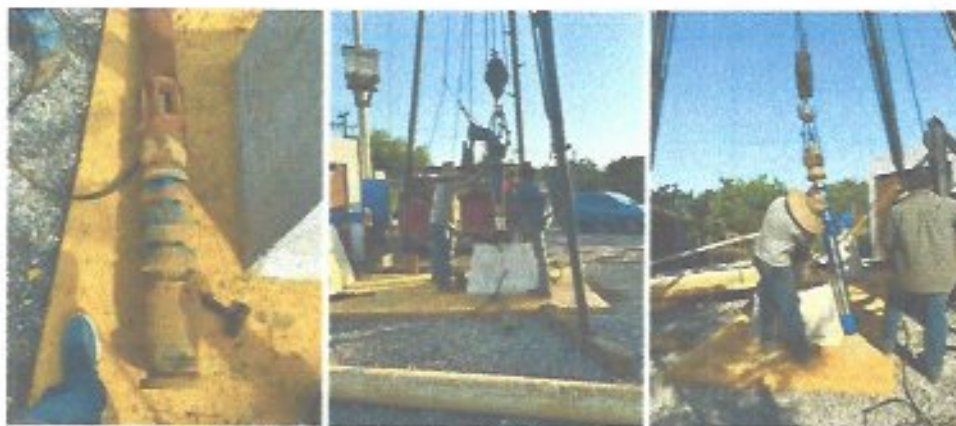
Figura 22. Cambio de bomba en pozo la mezclita.

Se realizó la rehabilitación del pozo “El Naranja” mediante la colocación de casquillos, con el objetivo de prevenir un posible derrumbe del ademe y prolongar la vida útil de la infraestructura; asimismo, durante esta intervención se solucionó la problemática existente con el equipo de bombeo que se encontraba atascado, logrando su liberación y restableciendo las condiciones adecuadas de operación de la fuente de abastecimiento.