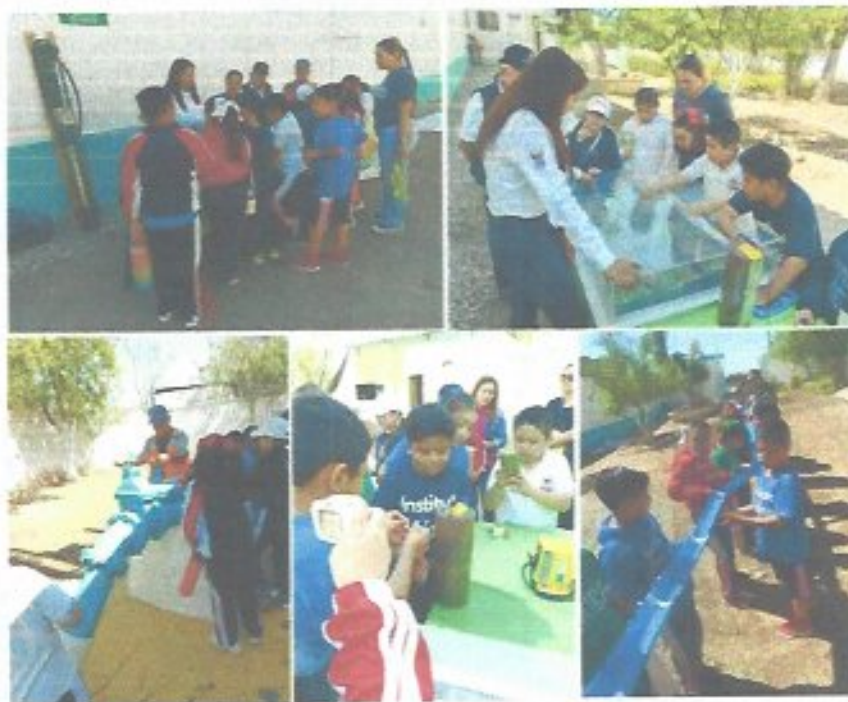
Figura 33. Recorrido en la zona pozos con alumnos de primaria.

Se realizó un recorrido técnico por la zona de pozos, en coordinación con personal de la Gerencia Operativa, dirigido a los alumnos de 3° "A" de la Escuela Primaria Particular México. Durante la visita se explicó de manera detallada el origen del recurso hídrico, el proceso de extracción mediante sistemas de bombeo y su posterior conducción y distribución hasta los domicilios