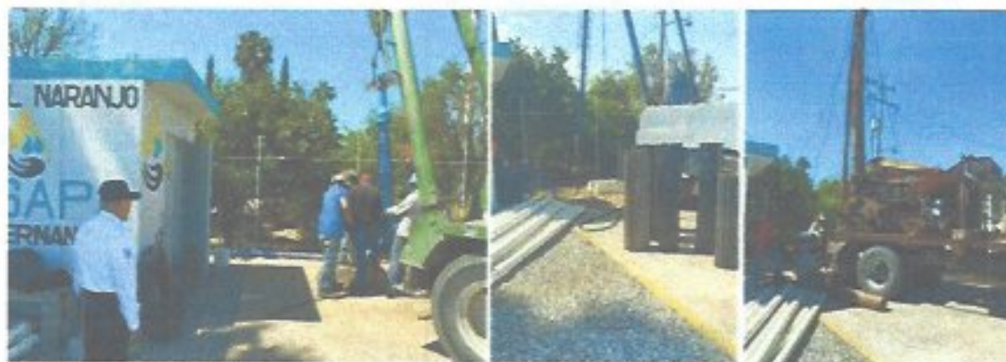
Figura 23. Maniobras de rehabilitación en el pozo “El Naranja”.

Se realizó la rehabilitación del pozo “El Naranja” mediante la colocación de casquillos, con el objetivo de prevenir un posible derrumbe del ademe y prolongar la vida útil de la infraestructura; asimismo, durante esta intervención se solucionó la problemática existente con el equipo de bombeo que se encontraba atascado, logrando su liberación y restableciendo las condiciones adecuadas de operación de la fuente de abastecimiento.