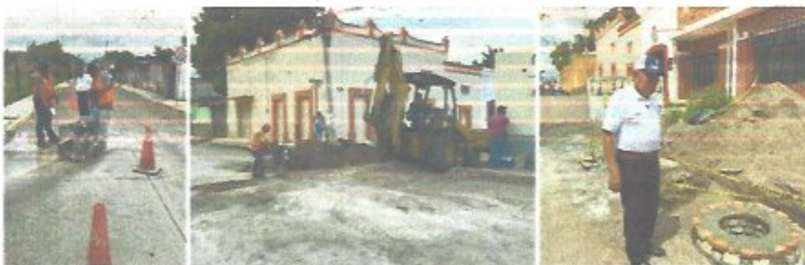
Figura 25. Rehabilitación de drenaje pluvial en calle Javier Mina.

Se llevó a cabo la rehabilitación del drenaje pluvial ubicado en la calle Javier Mina, el único sistema de este tipo con que cuenta el organismo, debido a que la tubería presentaba una saturación considerable de lodos y arena, derivado de la falta de mantenimiento en los últimos cinco años. Como parte de la intervención, se construyeron dos pozos de visita intermedios: uno entre las calles Juárez e Hidalgo y otro al norte de la calle Juárez, con la finalidad de facilitar las labores de inspección y mantenimiento preventivo y correctivo a futuro. Esta obra permitió restablecer la capacidad hidráulica del sistema pluvial, mejorar el desalojo de aguas durante la temporada de lluvias y fortalecer la infraestructura para su conservación a largo plazo.