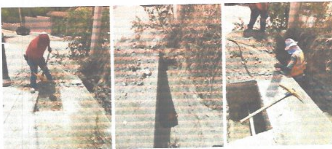
Figura 17. Trabajos en manguera aérea para mejorar la presión en un sector de la localidad de Llanitos.

Se realizó la reconexión de la manguera aérea que abastece la calle San Isidro, en la localidad de Los Llanitos, con el objetivo de incrementar la presión en dicho tramo de la red de distribución. Esta acción permitió optimizar el suministro en la zona, mejorando la continuidad y eficiencia del servicio para los usuarios del sector.