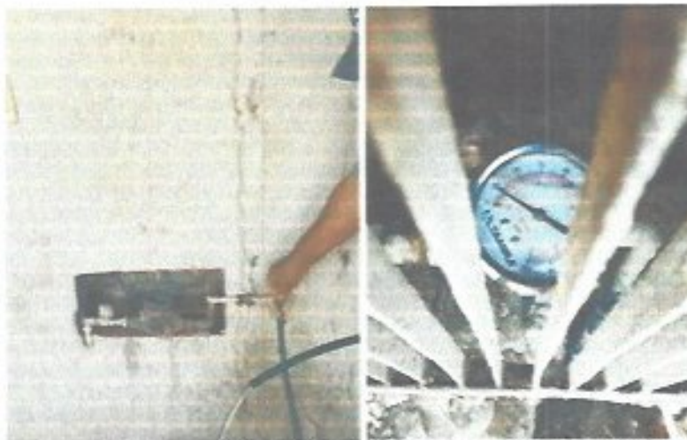
Figura 26. Monitoreo de presión en la localidad de Llanitos, para realizar acciones correctivas y mejorar la calidad del servicio.

Como parte de las acciones complementarias de supervisión y control, se realizó el monitoreo de presión en el sector norte de la red de distribución, correspondiente a la zona de Los Llanitos, mediante la instalación de manómetros y verificaciones en campo a través de visitas domiciliarias. Esta actividad tuvo como objetivo identificar posibles zonas con baja presión y generar acciones correctivas oportunas que permitieran optimizar el funcionamiento hidráulico del sistema y mejorar la calidad del servicio en dicho sector.