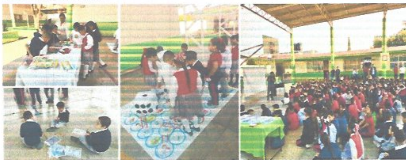
Figura 32. Platicas escolares a alumnos de primero, segundo y tercer año de la telesecundaria Lázaro Cárdenas.