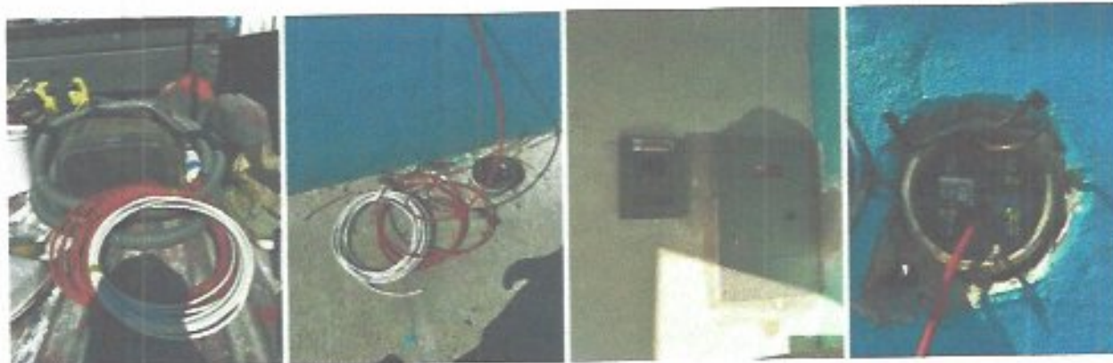
Figura 4. Mantenimiento de la red eléctrica en las oficinas del organismo.