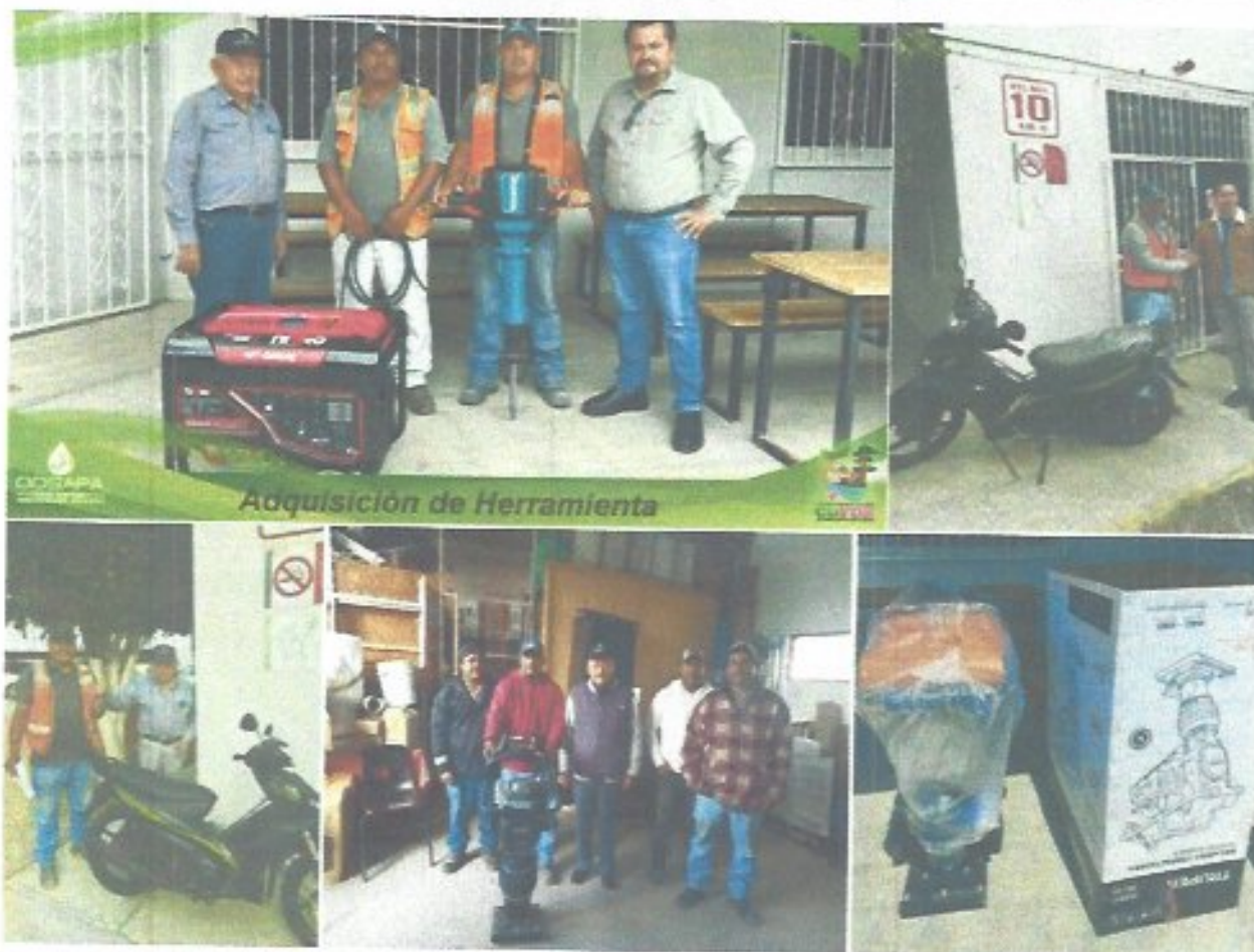
Adquisición de Herramienta