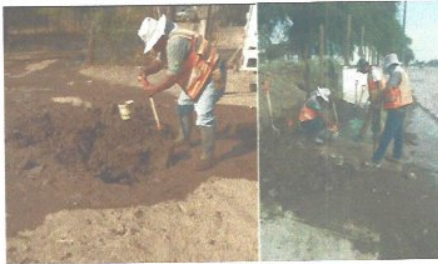
Figura 13. Reparación de fugas por parte de personal operativo en nuestra área de jurisdicción.

Durante el periodo que se informa, se realizaron 137 conexiones de tomas de agua potable, de las cuales 131 correspondieron al sector doméstico, 5 al sector comercial y 1 al sector industrial. Asimismo, se efectuaron 147 conexiones de descargas de drenaje sanitario, derivadas de los contratos formalizados por el área comercial, ejecutándose en tiempo y forma conforme a los procedimientos establecidos. Estas acciones contribuyeron a la ampliación de la cobertura de los servicios, a la regularización de nuevos usuarios y al fortalecimiento de la infraestructura hidráulica y sanitaria del municipio, garantizando una incorporación ordenada y eficiente al sistema.