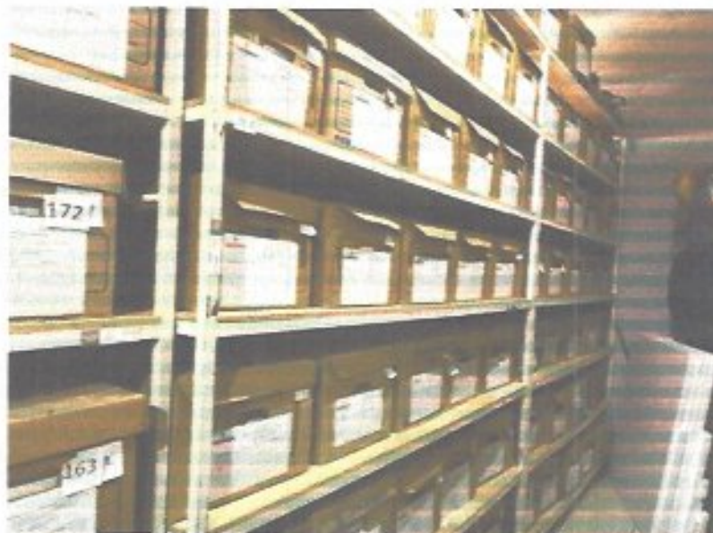
Figura 46. Archivo histórico.

El Departamento de Archivo asume el compromiso de consolidar procesos archivísticos sistematizados que garanticen el adecuado cumplimiento del ciclo vital de los documentos, desde su producción hasta su destino final. A través de un modelo integral de gestión documental, en estricto apego al marco normativo vigente, se asegura la correcta identificación, clasificación, valoración, conservación y control de la documentación institucional. Estas acciones fortalecen el orden interno, la trazabilidad de la información, la transparencia y la rendición de cuentas, contribuyendo a la preservación de la memoria institucional del organismo.