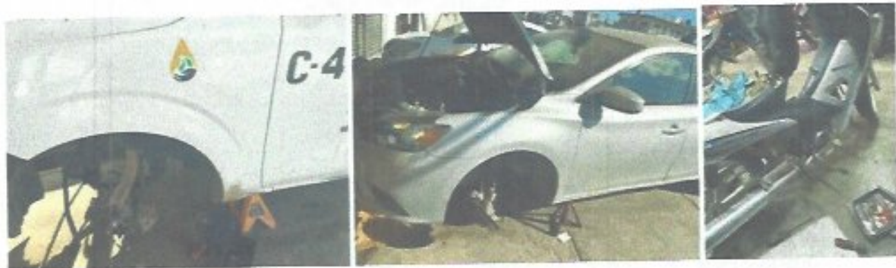
Figura 5. Mantenimiento a vehículos del organismo.

Durante el presente ejercicio se procuró mantener en óptimas condiciones la flota de vehículos y motocicletas del organismo, realizando mantenimientos preventivos y reparaciones correctivas a todas las unidades, con el objetivo de garantizar su funcionamiento continuo y seguro en apoyo a las labores operativas. Se reportó la reparación y mantenimiento 14 veces en vehículos, 20 veces en motocicletas y 4 veces en motocarro, asimismo, se implementó un control ordenado del suministro de combustible mediante el uso de vales y bitácoras, fortaleciendo la supervisión, la transparencia y el uso eficiente de los recursos asignados.