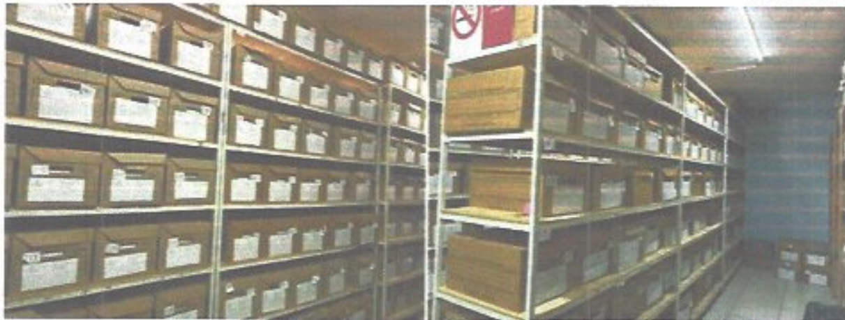
Figura 45. Archivo de concentración.