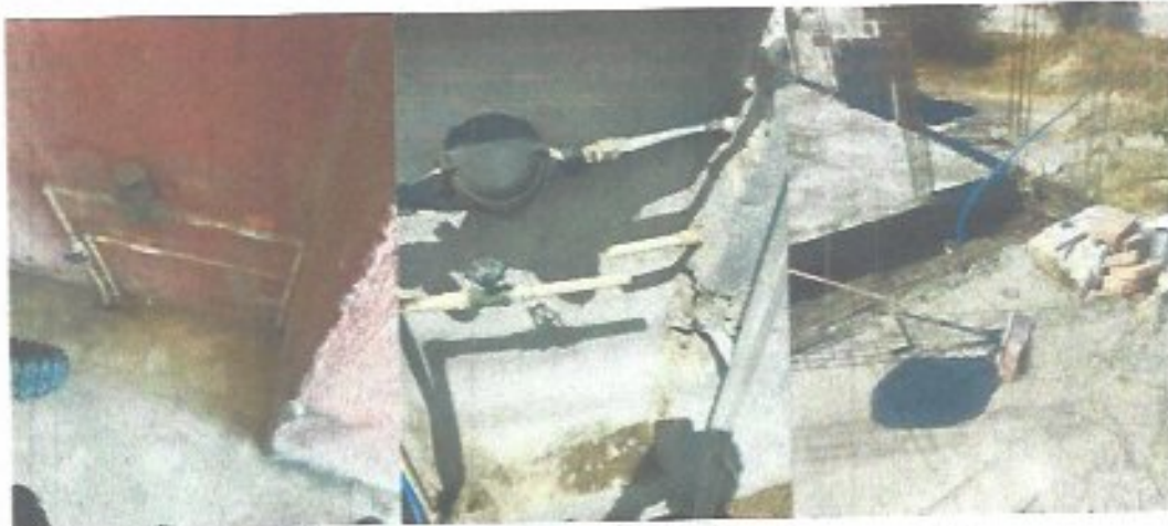
Figura 11. Tomas clandestinas localizadas en campo.