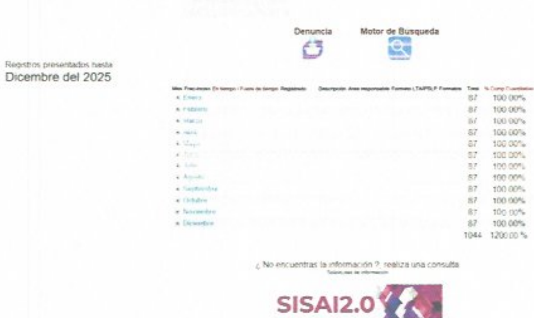
Figura 44. Porcentaje de cumplimiento mensual.

De enero a diciembre del 2025, la Unidad de Transparencia (UT) recibió un total de 26 solicitudes, las cuales ingresaron a través de la Plataforma Nacional de Transparencia (PNT) Sisai2.0, las solicitudes corresponden a Acceso a la Información Pública y para el ejercicio de los derechos ARCO no se presentó ninguna solicitud; se recibieron 3 Solicitudes de manera presencial a este Organismo Operador Paramunicipal Descentralizado de Agua Potable Alcantarillado y Saneamiento de las Autoridades del Ayuntamiento de Ciudad Fernández, S.L.P.