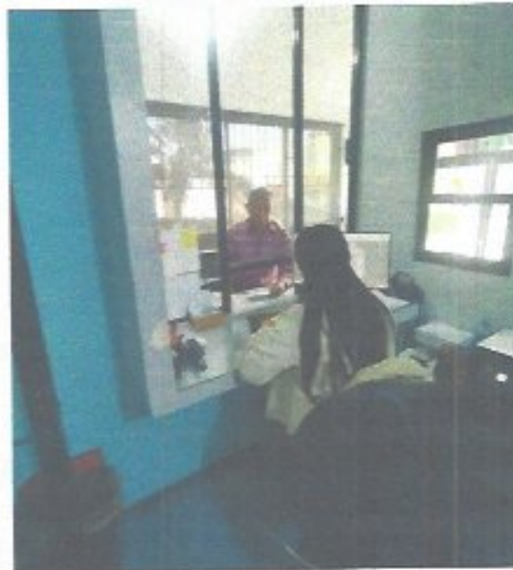
Figura 8. Atención a trámite para alta de usuario INAPAM.