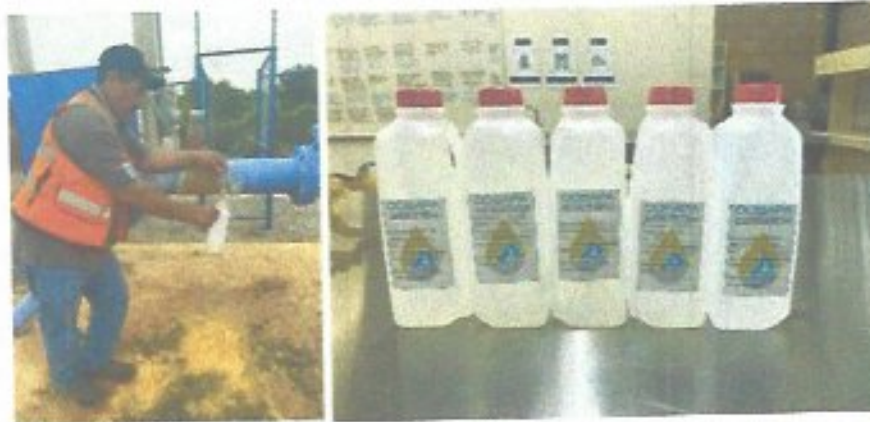
Figura 16. Muestra realizado a pozos para garantizar la dotación de agua segura a nuestros usuarios.