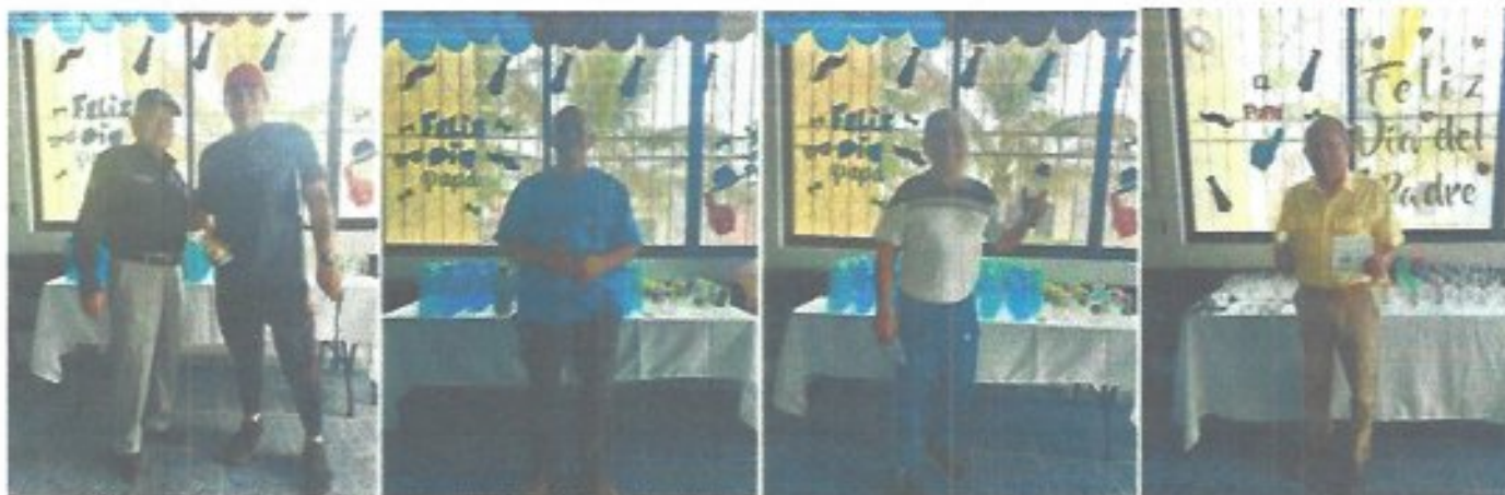
Figura 40. Pago oportuno día del Padre* entrega de regalos a los papas que acudieron a pagar su recibo del agua.