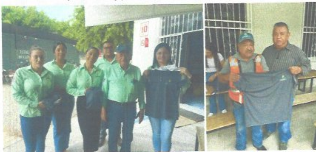
Figura 6. Entrega de uniformes a plantilla laboral.

Durante el ejercicio 2025 el organismo fortaleció su imagen institucional mediante la adquisición de uniformes para la totalidad de la plantilla laboral, tanto del área administrativa como operativa, promoviendo una identidad corporativa sólida y una mejor presentación ante la ciudadanía. Asimismo, esta acción contribuyó a facilitar la identificación del personal en campo, brindando mayor seguridad y confianza a los usuarios durante la realización de trabajos operativos, además de reforzar el sentido de pertenencia y profesionalismo dentro de la institución.