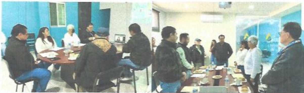
Figura 1. Reunión de junta de gobierno en las instalaciones del organismo.