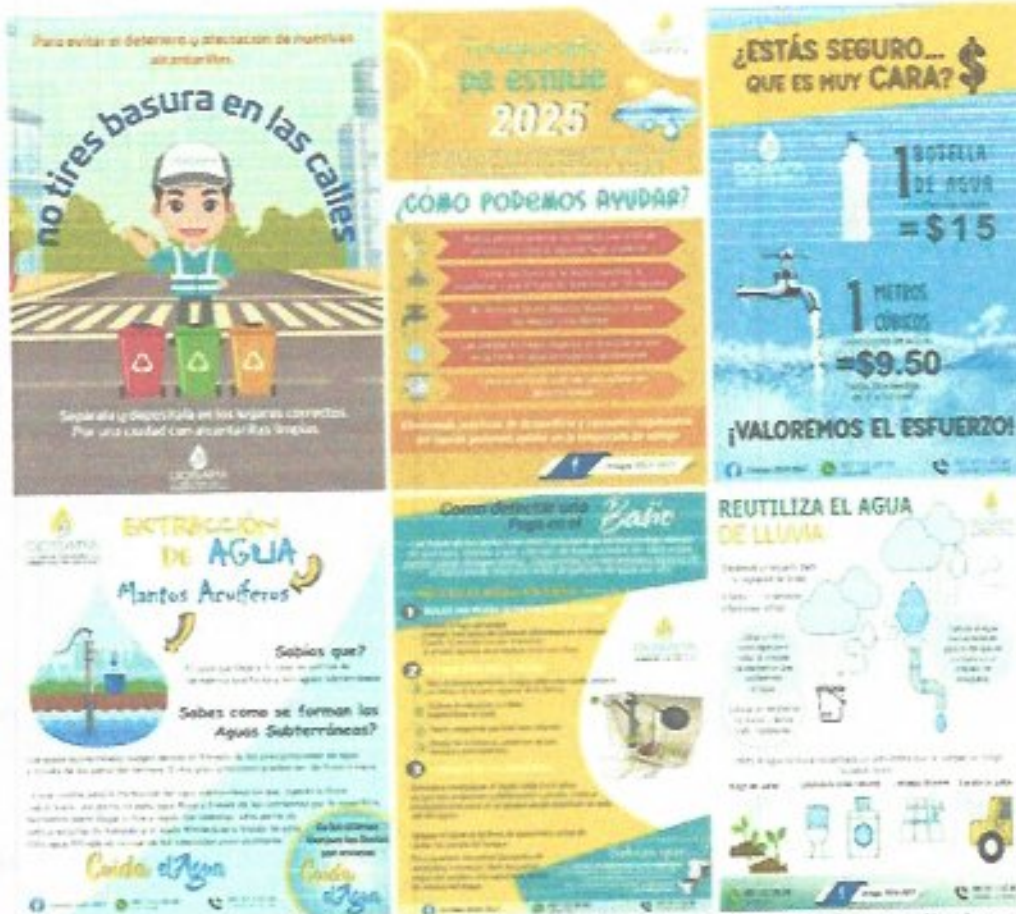
Figura 41. Difusión de estrategias para evitar el colapso del drenaje sanitario y descargas domiciliarias en periodos de lluvias.

En coordinación con la Gerencia Comercial, se dio continuidad a la difusión en redes sociales de infografías relacionadas con las modalidades de pago disponibles, incluyendo el uso de tarjeta de débito y crédito, banca multipagos, así como información sobre el cuidado del medidor y avisos relativos a la cobranza. Asimismo, se promovió la ubicación de los establecimientos comisionistas autorizados, con el propósito de facilitar a los usuarios el acceso a puntos de pago cercanos.