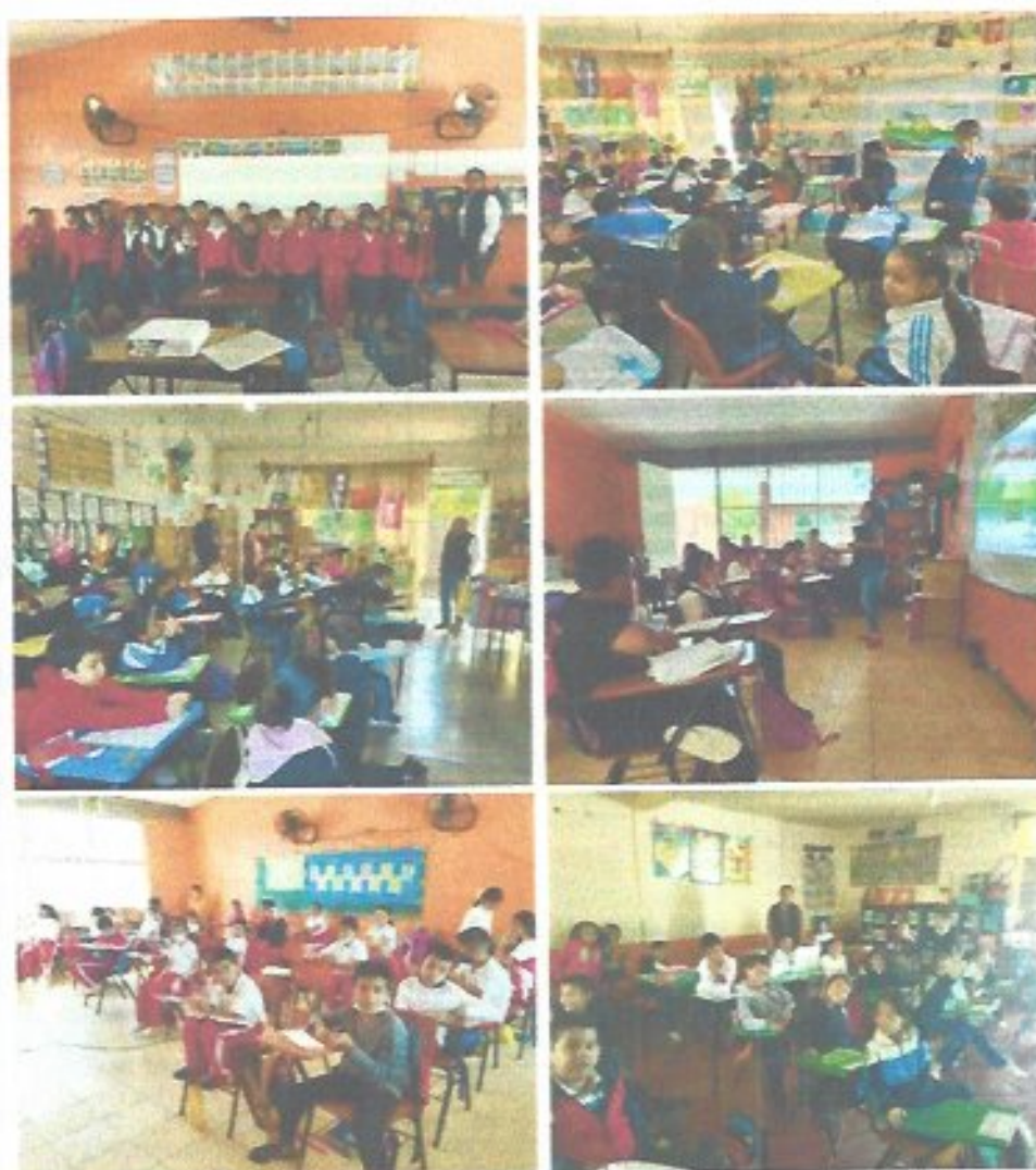
Figura 30. Platicas escolares con alumnos de primero, segundo y tercer año de primaria, en las escuelas Belisario Domínguez y Juan Miranda Uresti.

Se impartieron platicas a alumnos de diferentes escuelas desarrollando el tema "DE DONDE PROVIENE EL AGUA, USO SUSTENTABLE DE LA MISMA" en el Jardín de Niños Escuela Primaria Juan Miranda Uresti, Escuela Primaria Belisario Domínguez, Escuela Telesecundaria Lázaro Cárdenas, las cuales se impartieron a todos los grados y grupos de las escuelas en mención, cabe destacar que se atendieron 1500 alumnos.