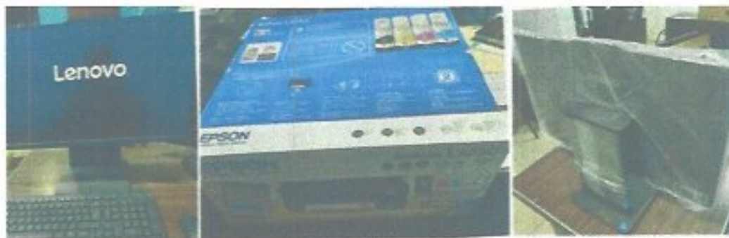
Figura 2. Equipo de cómputo adquirido durante el ejercicio.

Durante el ejercicio 2025 se fortaleció la infraestructura tecnológica del organismo mediante la adquisición de 7 nuevos equipos de cómputo, los cuales fueron distribuidos estratégicamente en las distintas áreas para renovar y actualizar las herramientas de trabajo. Asimismo, se incorporaron 7 impresoras que sustituyeron equipos obsoletos o en mal funcionamiento. De manera complementaria, se brindó mantenimiento correctivo a 13 equipos de cómputo y 6 impresoras que aún se encontraban en condiciones operativas, optimizando así los recursos disponibles. Adicionalmente, se realizó mantenimiento al servidor del área contable, garantizando la estabilidad del sistema y la continuidad en el cumplimiento de las obligaciones fiscales y administrativas del organismo.