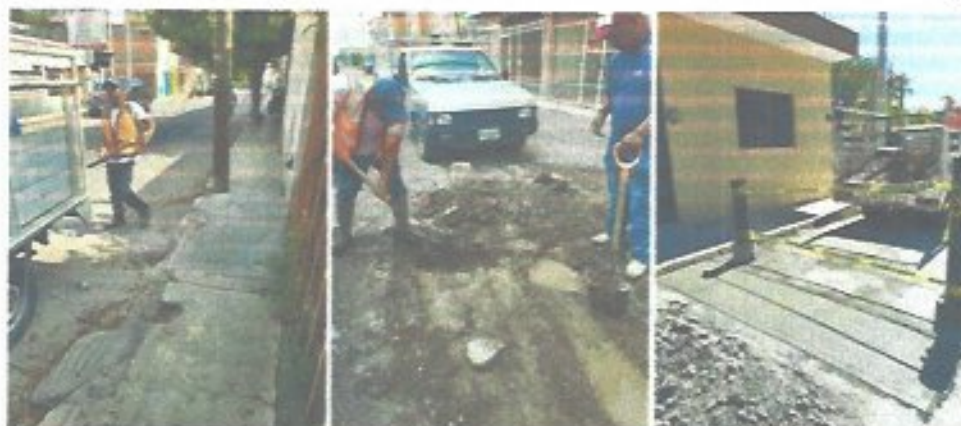
Figura 27. Trabajos dentro del programa de bacheo permanente.

Durante todo el año se brindó atención permanente a los contratistas del municipio, supervisando y verificando la realización de pruebas de hermeticidad en infraestructura de agua potable y en líneas de drenaje sanitario, con el propósito de garantizar la correcta ejecución de las obras, asegurar la calidad de los trabajos y prevenir fugas o filtraciones que pudieran afectar el adecuado funcionamiento de los sistemas.