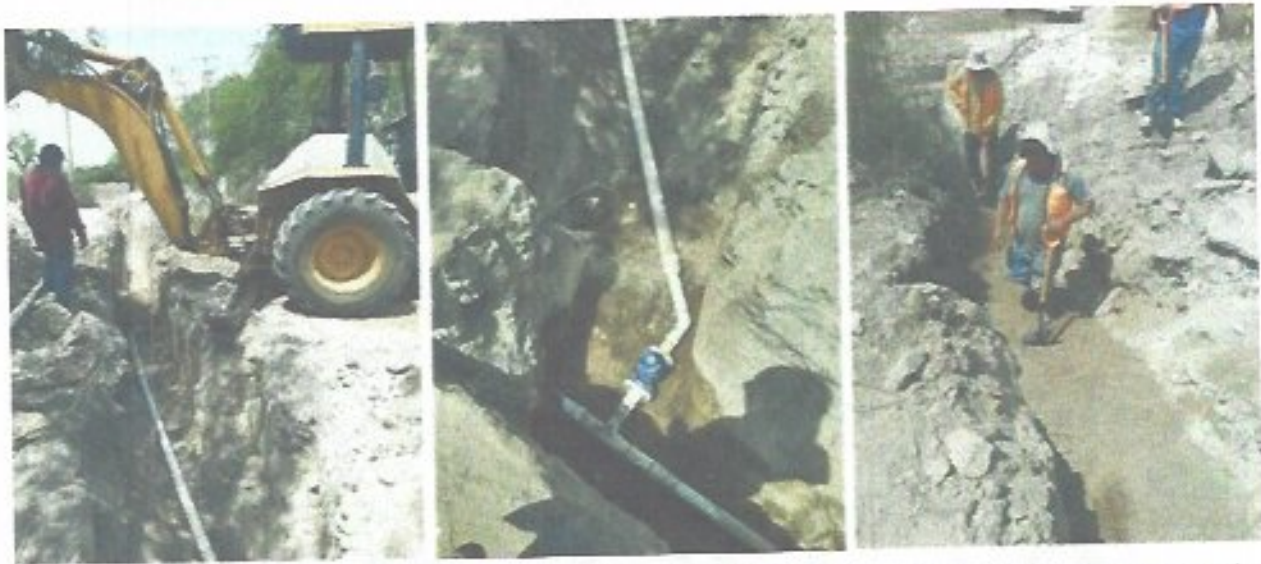
Figura 18. Interconexión de red de agua potable en calle Progreso, colonia Fertimex localidad de Llanitos.

suministro, beneficiando a más de 1,500 habitantes del ejido Los Llanitos. Con esta intervención se fortaleció la infraestructura existente y se dio respuesta a una necesidad prioritaria de la población, mejorando las condiciones del servicio en la zona.