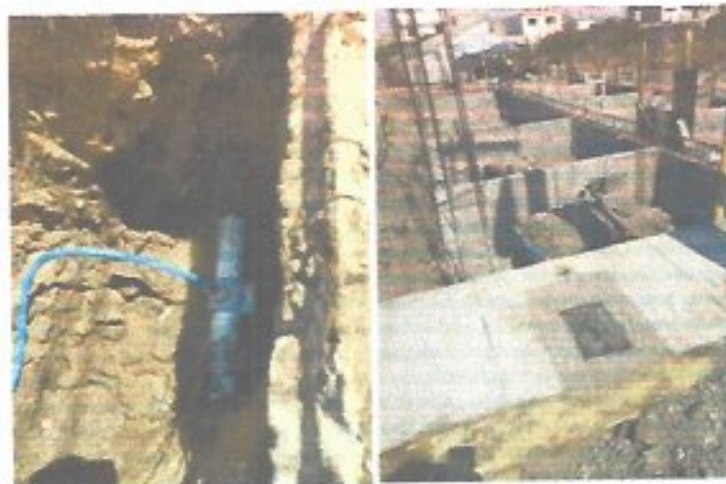
Figura 14. Instalación y conexión de servicios de agua potable.

Durante el periodo que se informa, se realizaron 137 conexiones de tomas de agua potable, de las cuales 131 correspondieron al sector doméstico, 5 al sector comercial y 1 al sector industrial. Asimismo, se efectuaron 147 conexiones de descargas de drenaje sanitario, derivadas de los contratos formalizados por el área comercial, ejecutándose en tiempo y forma conforme a los procedimientos establecidos. Estas acciones contribuyeron a la ampliación de la cobertura de los servicios, a la regularización de nuevos usuarios y al fortalecimiento de la infraestructura hidráulica y sanitaria del municipio, garantizando una incorporación ordenada y eficiente al sistema.