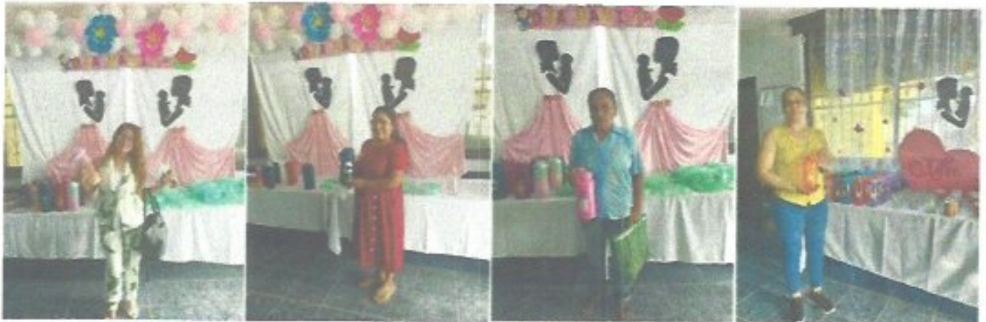
Figura 39. Campaña "Pago oportuno día de la Madre" entrega de regalos a las mamás que acudieron a pagar su recibo del agua.