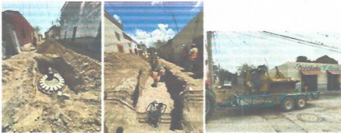
Figura 24. Construcción de 65 m lineales en calle Javier Mina, beneficiando alrededor de 20 personas.

infraestructura básica, demostrando que la coordinación interinstitucional y social permite optimizar recursos y alcanzar metas comunes en beneficio de la comunidad.