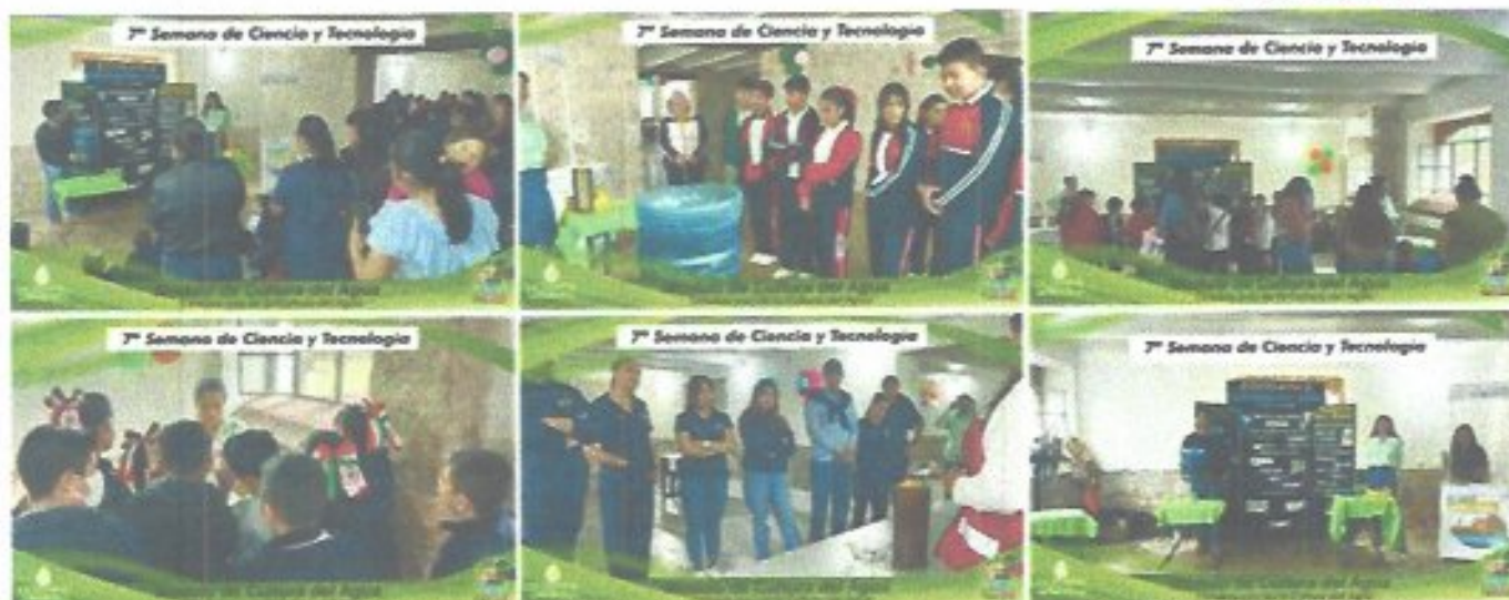
Figura 36. Instalación de Stand en el Balandrán apoyando con los temas "Funcionamiento de un pozo y Filtro de agua".

Asimismo, se participó en la 7ª Semana Estatal de Ciencia y Tecnología (7ª SECyT), organizada por la Facultad de Estudios Profesionales Zona Media de la UASLP. El Organismo instaló un módulo informativo el 13 de octubre, donde se promovió el uso racional del agua, la protección de los mantos acuíferos y se brindó información sobre el funcionamiento de los pozos de abastecimiento, reafirmando el compromiso institucional con la difusión de la cultura del agua.