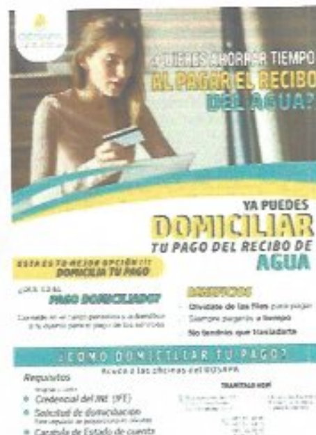
Figura 9. Promoción de la domiciliación del pago por el servicio.